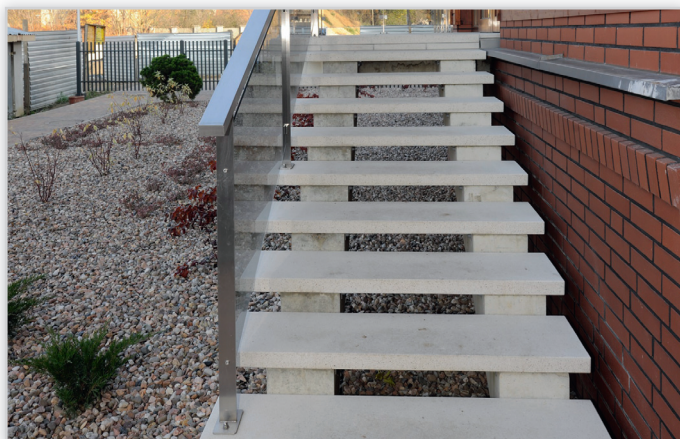
Okładzina schodowe terazzo. Terazzo doskonale sprawdza się w roli okładziny schodowej lub bloku schodowego na zewnątrz budynku. Istnieje możliwość wtopienia na etapie produkcji wkładek ochronnych i przeciwpoślizgowych z PCV, chroniących krawędzie stopni przed uszkodzeniami i zwiększających bezpieczeństwo użytkowników.