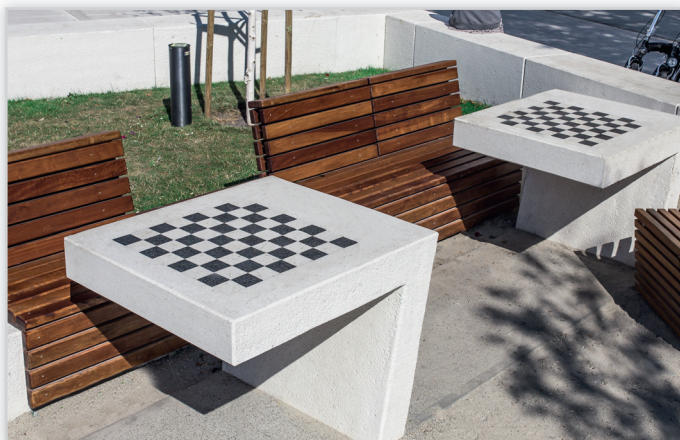
Mała architektura – to produkty pozwalające na efektywne aranżowanie kompozycji na miejskich placach, w ogrodach, a także wokół domów.