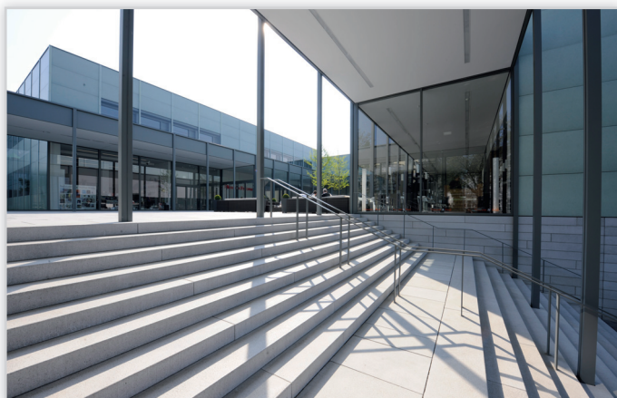
Efektowne okładziny schodowe z terazzo są sprawdzonym, powszechnie stosowanym w całej Europie materiałem. Produkowane z tych samych materiałów co płytki, łączą zalety posadzki z terazzo z unikalnymi właściwościami.