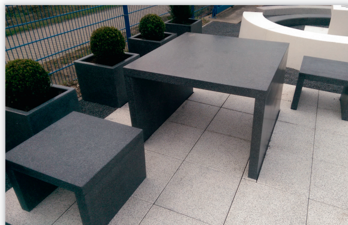
Ławki, donice, fantazyjne kule i półkule – nawet najmniejszy element krajobrazu może zyskać estetyczne i oryginalne wykończenie.